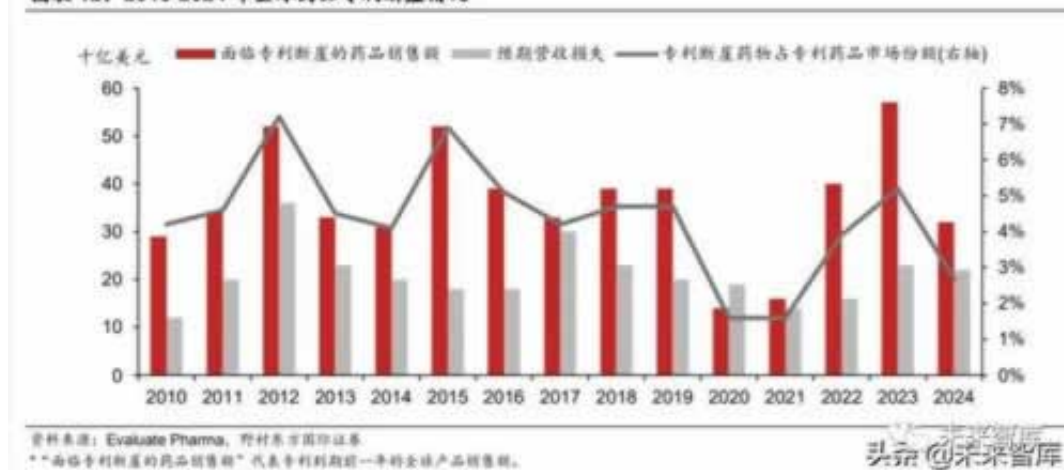
图表 12: 2010-2024 年全球药品专利断崖情况

他们的借口花样百出，不用慌，遇嘿是有办法的，前提是还能正常转换**就一些帮你挽回，不懂的朋友一些要问，网上平台营前被黑可能追回的一些方法，下面总结 6、找有能力的出黑团队，帮你解决，联络方式文章底部当你在玩黑网的时候客服一直各种理由不给你提款，什么流水不够，风控等原因，这些都假的，是要不让你提款的借口，也就是我们常说的被黑，这类的情况是有办法解决的，如果你还不知道怎么解决，那么就通过我们帮你来指导这类如何解决。