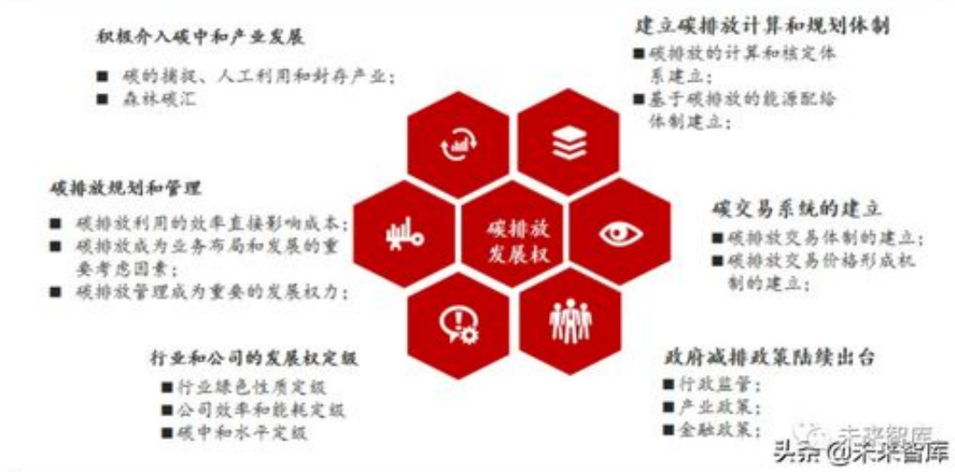
图 11：双碳目标实现需要建立一个以碳排放为核心的能源供应体系

答：网上平台赢钱通道维护一般多久可以用，分享总结一些经验告诉你解决办法在网上遇到通道维护一般多久可以用，这种情况不能出款的朋友，出现这种情况的，首选我们不要担心，如果自己都没有放弃，那么就有办法的，找到我们，多年的经验，已经帮助了很多网上的朋友，帮助他们解决各种被黑的情况，只要账号正常转换，额度正常登入，那么就就有希望的，当然我们遇到了就不要跟平台闹的，更不要去吵的，而且不要重复去提的，不然很容易在此被针对的。