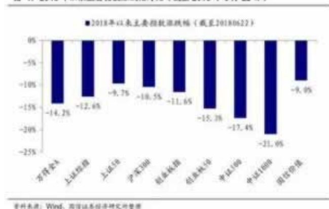
图 1: 2018年以来主要股指涨跌幅对比(截至2018年6月22日)

平台客服告诉你不能出款，其实肯定有原因的，如果是正常出的，那么很快就审核通过了，其实他们就是不给你提，让你自己继续玩的，所以这就是平台的目的，那么有什么办法可以解决，能解决注单未回传，流水未达标，维护延迟出款等等，只能平台能登入，是综合的平台，那么完全就有机会的，如果是纯采，那么肯定是没办法，因为这种平台藏不了解分的，一部分也是骗子的平台，所以大家可以好好看看自己平台的情况，不懂的可以快速咨询我们，我们将为您详细解读（屏幕底部微信，全网最靠谱的出黑）碰到黑网提款注单未更新不能出款，很多人碰到这种情况都是非常不爽的，冲动的想找平台理论，或者直接威胁平台不给出款要怎么，其实冲动都是解决不老问题的，平台敢不给你取钱，那么肯定不吃你这套的，这种他们