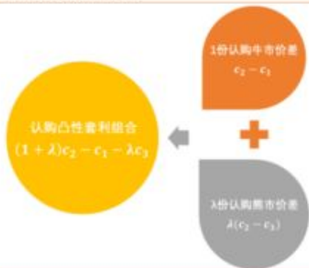
图 47：认购凸性套利组合拆分

了解更多的办法和解决方式上理财，金服网上流水不足不给提款，下面总结6点解决办法告诉你、要保持良好的心态，要知道人的一生中遇到困难是必然的，当你遇到困难时，良好的心态是解决问题的根本，要相信没有跨不过去的坎。