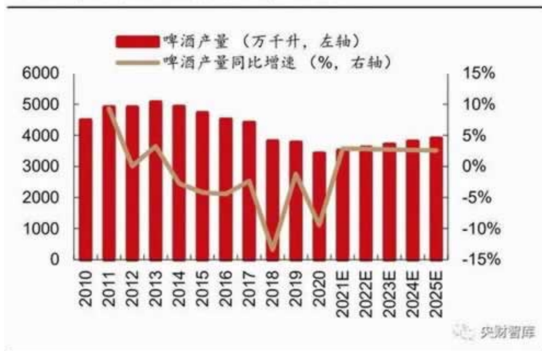
图 35：中国啤酒行业年产量及同比增速

答：根据此，大家就储蓄卡被锁定的普遍缘故、处理方法等有关难题开展剖析，便于大伙儿在碰到上述所说情况时要立即合理的开展解决处理。