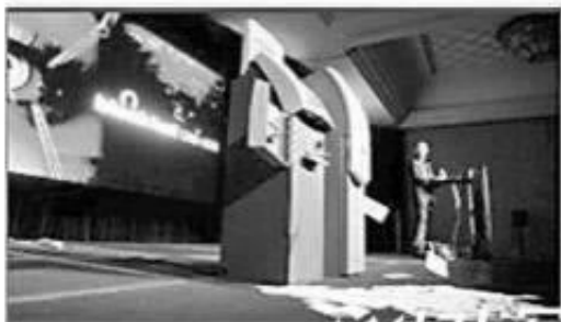
在黑客会议上，自动取款机不断吐出钞票。

方通道维护怎么办，很多碰到这种情况的老铁都是非常奇怪的，怎么会出现了这种情况了，其实很多时候都是平台的问题，因为有的平台都是有进无出的，什么叫有进无出的，其实就是搞咋骗的平台，骗子怎么会让你出了，被黑审核一直不给出款该怎么办。