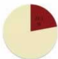
2017年数字经济贡献就业人数比例

• 2017年中国数字经济规模达到27.2万亿人民币； • 同比增长达到10.3%；