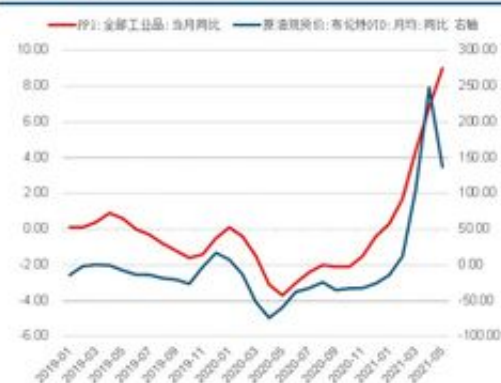
图 22: PPI 同比与原油价格同比 1

答：藏分技术完全可以解决的，特别是出现注单异常一直不能提款，这种情况，也是可以的，所以碰到了就咨询我们，我们的联系方式在屏幕底部，通过出黑工作室也是可以找到我们的。