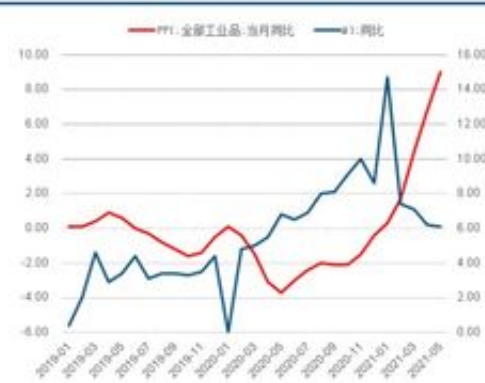
图 23: PPI 同比与 M1 同比 1