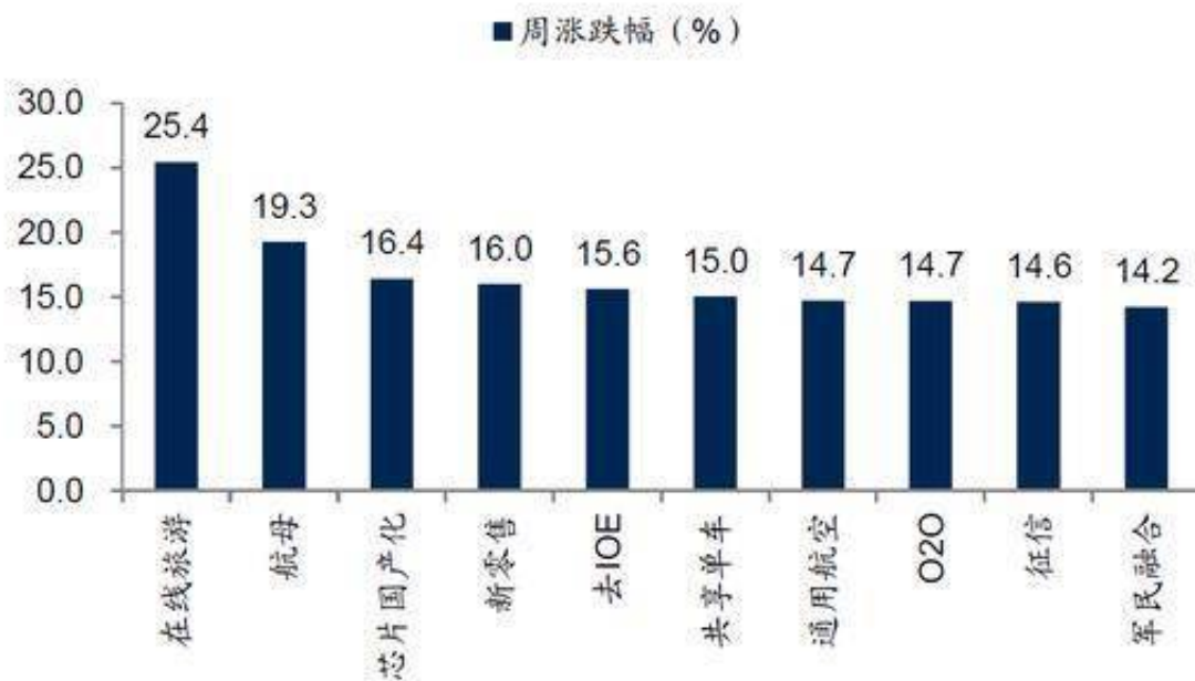
图 7: 上周涨幅最大(跌幅最小)的十个主题概念板块

多年大师告诉你当我们不懂的风险的时候，那么风险就可能找上你了，特别是接触的惘投平台，那么很可能让你亏损严重的，他们通过惘投被黑不能出款的情况，把的你账号的钱黑了，让你账号里面的钱只是一堆数字而已，我们要第一时间保存证件，让出黑工作室来帮助我们。