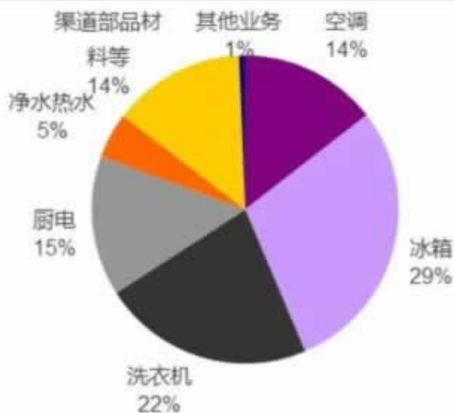
图 24：海尔收入结构：冰洗占据半壁江山（2019 年）