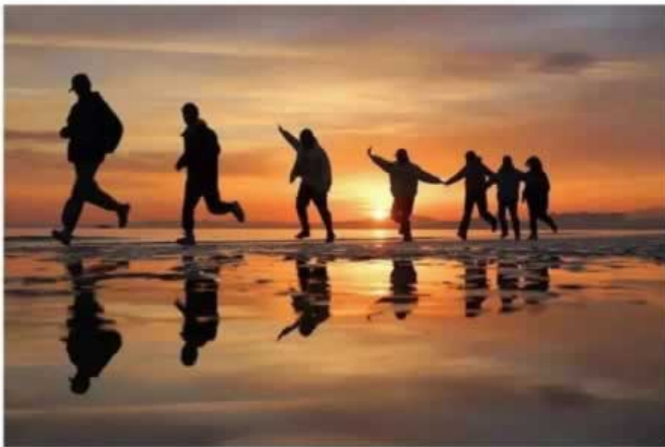
▲ 2021年11月28日，山东省烟台市一处海滨沙滩，一队晨练的大学生正在跑步。

何处是生门，何方有出路？谁能争得先机，谁能笑到最后？唯主动破局，果断开局，抉方向，择先机，方能萃取绵绵不断的力量。