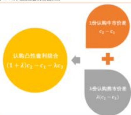
图 47：认购凸性套利组合拆分

业的介绍，专业团队，可以快速帮助你解决这个问题，特别是超过24小时不能出的，那么基本可以确定你被黑了，赶紧找我们处理吧朋友，不然后期账号可能被平台限制，限制登入，那么在找我们有什么办法能解决，那么我们也束手无策的，遇到这种情况，自己解决不了，那么肯定要找专业出黑团队帮助你。