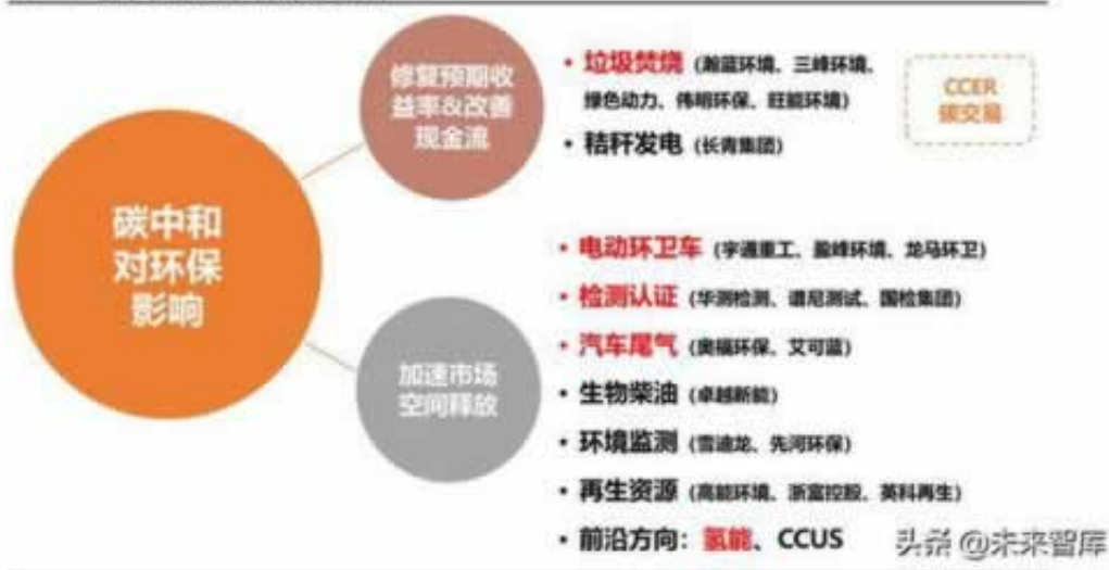
图 11: 碳中和带来的环保投资逻辑

提款失败总被退回说注单异常，遇到注单异常、违规操作等借口，如果超过24小时了还不能出款，那么可以肯定是被黑了，这个时候我们该怎么解决好，这种情况，如果你真的赢太多了，那么平台客服就会告诉你，你套利了，违规操作了，还有就是流水不足，你有刚开始赢钱了，那么就不要再考虑什么了，赶紧了全部提处理，不然后期赢的更多想出款，就更难了。