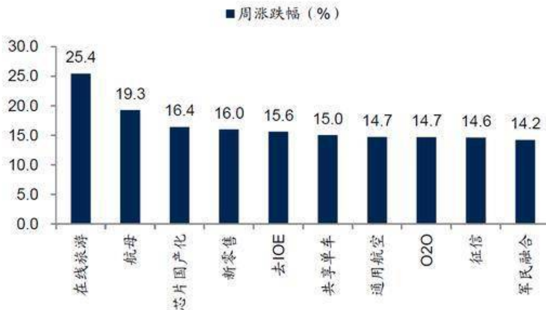
图 7: 上周涨幅最大(跌幅最小)的十个主题概念板块