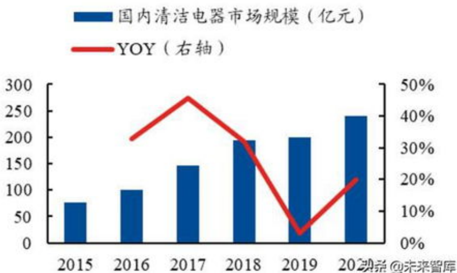
图 60、2015 至今中国清洁电器零售额情况

网上解决办法黑网站藏分技术是怎么出款的，下面来告诉你可以通过移分、过分、偷分、回分、涨分、藏分等等手段，让账号看起来好像已经没有分了，这个时候平台就会对你的账号放松监视，处于一种‘放养’的状态，我们在分批分次的把你的分慢慢的下出来。