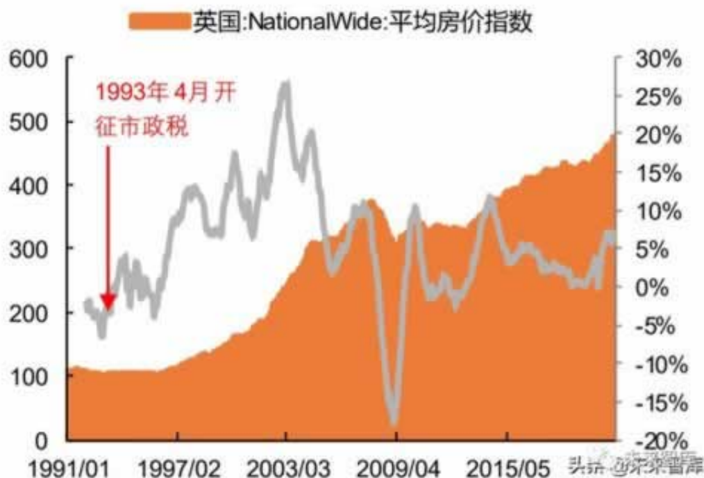
图表21 英国征收市政税前后房价变化

快速解决出款，一对一服务，不成功不收费的，解决的前提就是惘投账号能正常登入，分数能正常转换，如果现在的平台出现了第三通道维护怎么解决，这种问题，那么就找我们就行，联系方式文章底部的微信或者QQ。