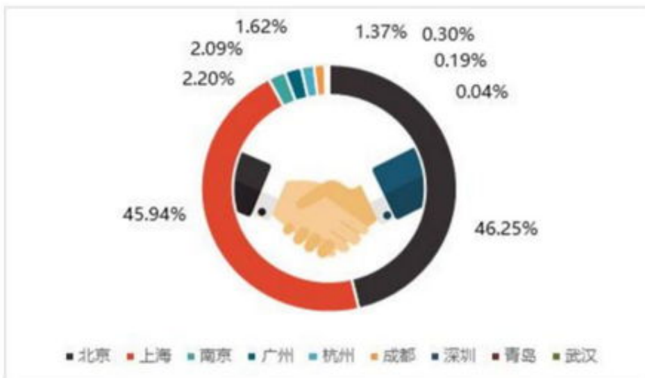
图：中国长租公寓股权融资金额城市分布

答：款通道维护升级一直被退回，首先是我们遇到问题是要保持冷静，只有在冷静状态下才能更好的去解决问题，好好想想他们为什么不给出，你想过没有既然他们不给你出了，为什么不直接冻结你的号。