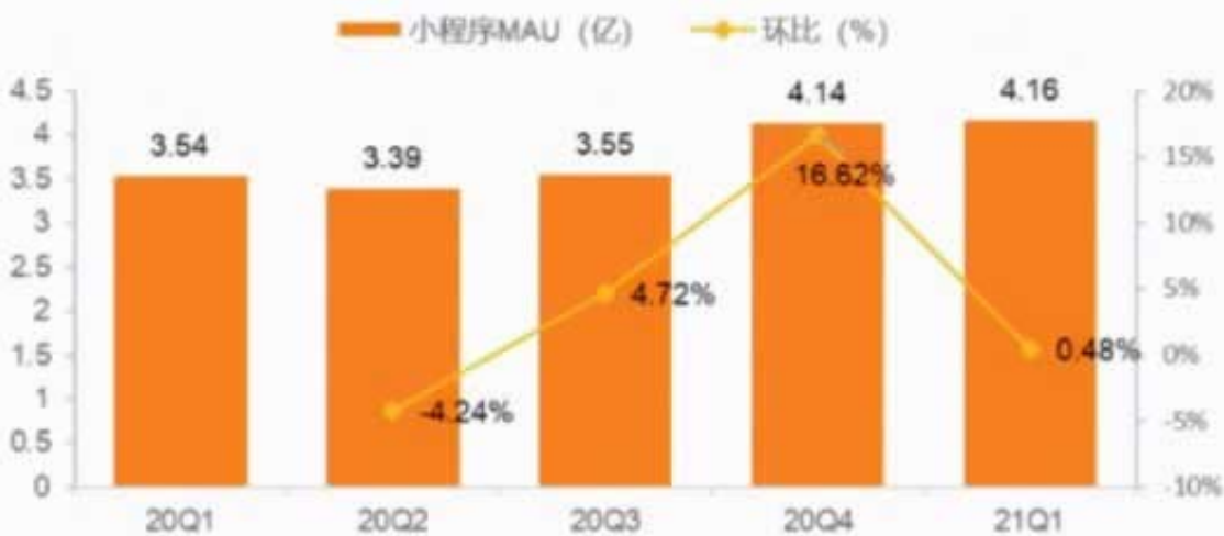
图 12: 百度 app 小程序 MAU (亿) 及环比增速