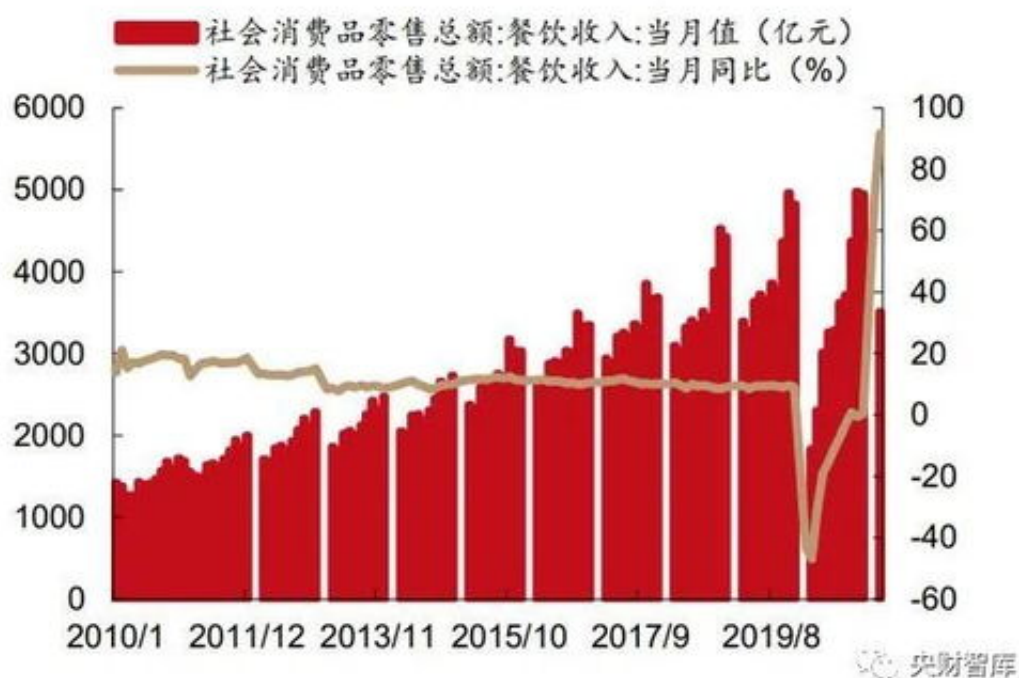
图 44：国内餐饮自 3 月以来加速复苏

答：其实对于这种账号异常，通常会称之为是假异常，是可以解决的，基本都是自己在日常操作中有一些问题，只要我们改掉自己的问题，基本过不了几天就可以让我们的账号恢复正常，到时候就可以提款了。