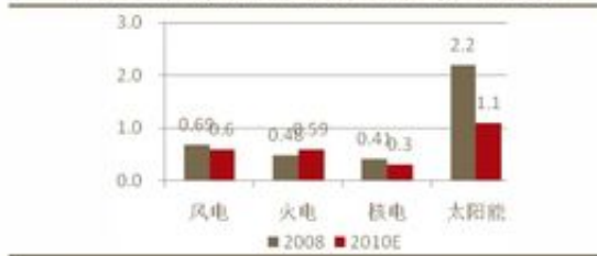
图表 27: 广东地区不同能源发电成本比较 (元/度电)