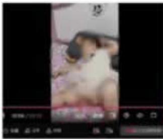
宝太难带，天天追着喂，二岁半的仔天天追着喂