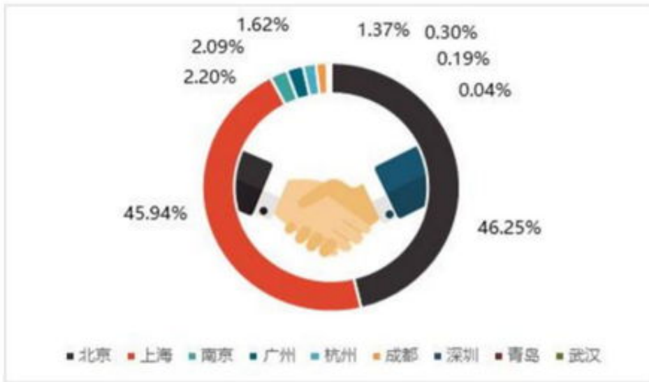
图：中国长租公寓股权融资金额城市分布