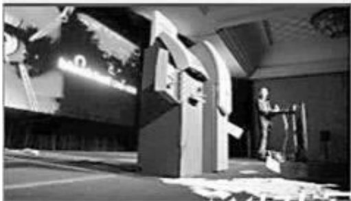
在黑客会议上，自动提款机不断吐出钞票。

王头是一项必须注意安全的弄项目，没有提款导致就不算的赢家，对应那些不小心在王头中出现亏损的人来说，找到解决的办法是至迫切的，当然我们应该提高防骗的意思，还有不要上一些虚假的，弄回报高的平台上进行王头，异常不给提款怎么追回损失这样才能从根本下解决这个问题。