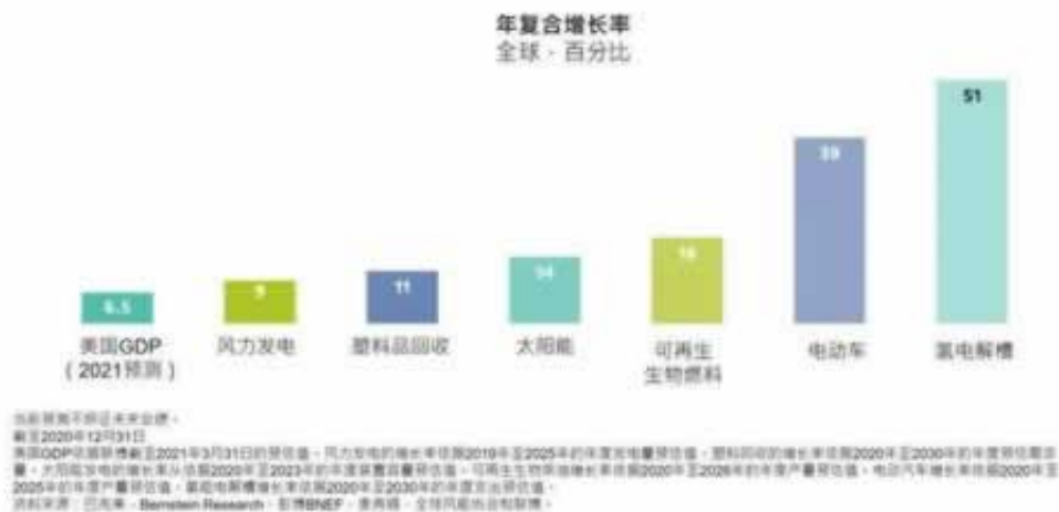
图2：气候解决方案可为企业带来与众不同的长期增长机会

在黑网账户异常取款失败，看我上面的文章如果你对不能正常出款，或者账户异常取款失败，这些情况，如果你现在没有解决的办法，不知道怎么办，那考验咨询下我们，我们可以帮你解决这类问题。