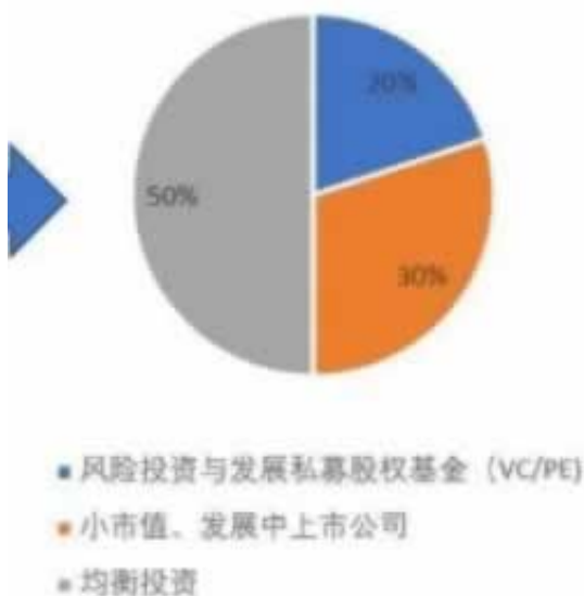
新的SIV签证合规投资框架

在网上很多被黑的情况都是赢多了，平台怀疑有套利的可能，还有就是平台就是黑平台，小额给你出可以，但是你想大额那么没门，他们就会限制你的账号出的，提款失败注单数据异常怎么处理。