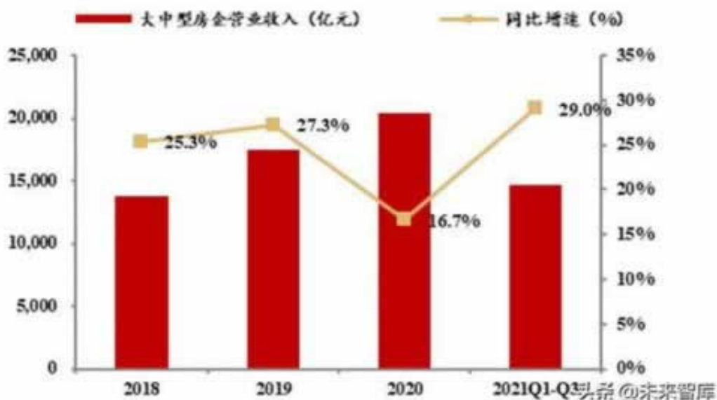
图 21 15 家大中型房企营业收入及同比增速

因为法律部门是很难帮你追回钱款的，哪怕你有证据，也很难帮你追回，毕竟追回这些钱需要耗费很多的人力物力，大多数部门都不会帮你。