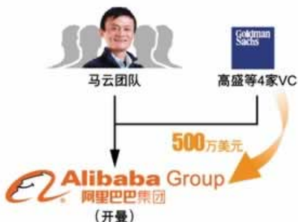
图4：阿里巴巴第一轮融资

答：事实证明并不是，出款通道维护问题并不是等几天就能顺利出款的，其中有诸多猫腻，一味等待是徒劳无功的做法，为了保证资金安全，也为了降低大家的损失，建议联系我们，将问题交给专业人士解决处理，这样能够快速挽回损失，顺利出款。